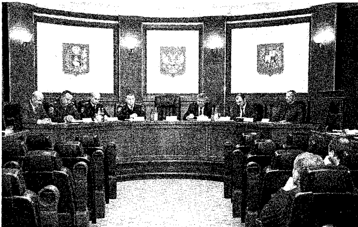
Заседание антитеррористической комиссии в г. Ставрополе

К числу недостатков регулирования компетенции государственных органов Ставропольского края по противодействию терроризму относится, по мнению авторов, закрепление за референтурой губернатора Ставропольского края (которая в силу Положения, утвержденного постановлением губернатора Ставропольского края от 30 июля 2008 года № 603, не относится к числу органов государственной власти) полномочий по осуществлению координации деятельности органов исполнительной власти Ставропольского края по их участию в организации выполнения юридическими и физическими лицами требований к антитеррористической защищенности объектов (территорий), находящихся в государственной собственности Ставропольского края или в ведении органов государственной власти Ставропольского края. Данные полномочия, исходя из п. 2 ч. 1 и п. 6 ч. 2 ст. 5.1 Закона № 35-ФЗ,